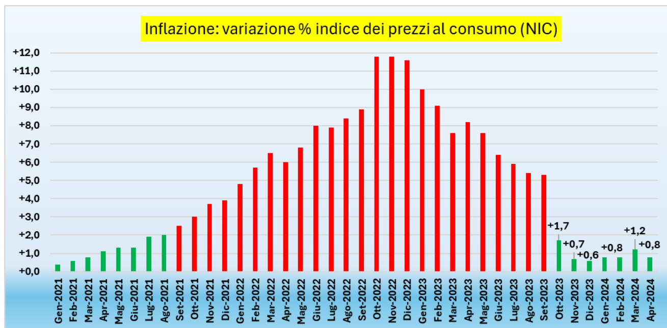
Graf. 1 – Inflazione italiana stabilmente sotto il 2% da ottobre 2023

Elaborazione Ufficio studi CGIA su dati Istat